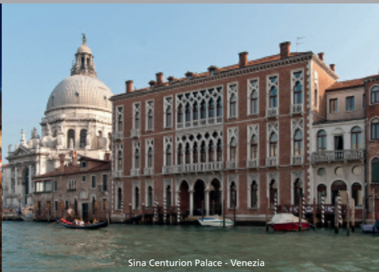
Sina Centurion Palace - Venezia