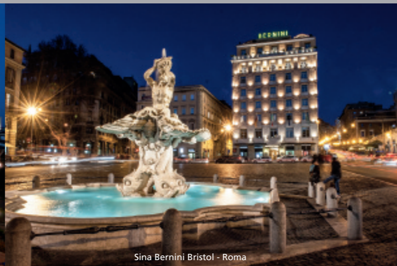
Sina Bernini Bristol - Roma