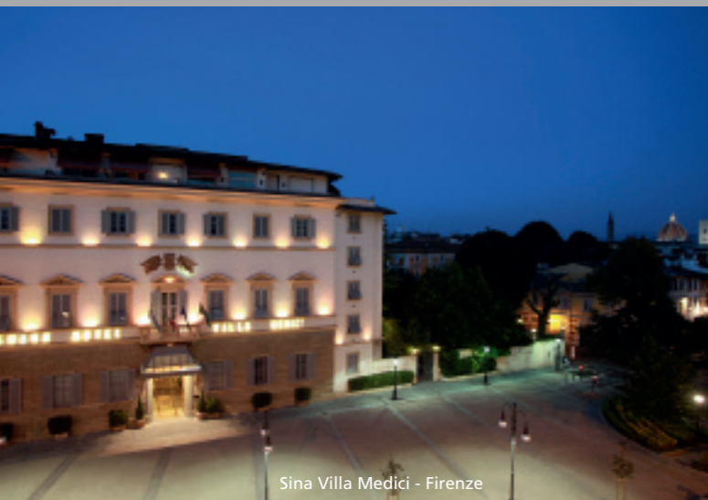
Sina Villa Medici - Firenze